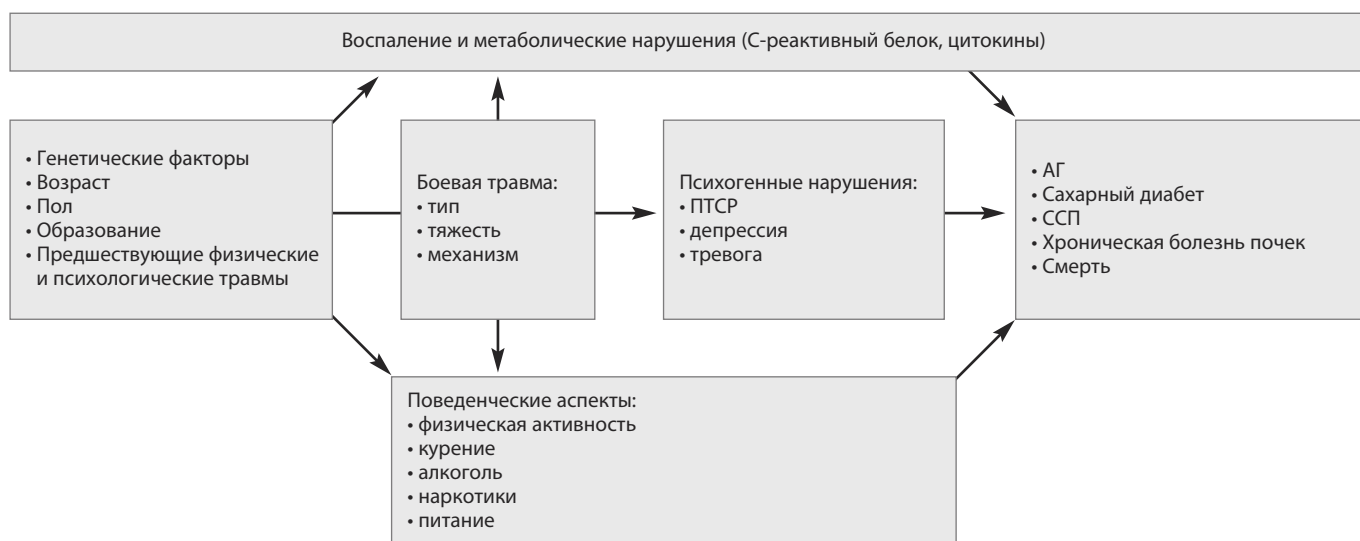
Рис. 1. Возможные механизмы влияния боевой травмы на различную патологию (J. Howard и соавт., с изменениями) [10]. Fig. 1 Possible mechanisms underlying the impact of combat injury on various disorders (according to Howard J.T. [10] with amendments).

таболические, психические и поведенческие факторы лежат в основе взаимосвязи между воздействием физической и психологической травмы и последующим развитием АГ (рис. 1) [10].